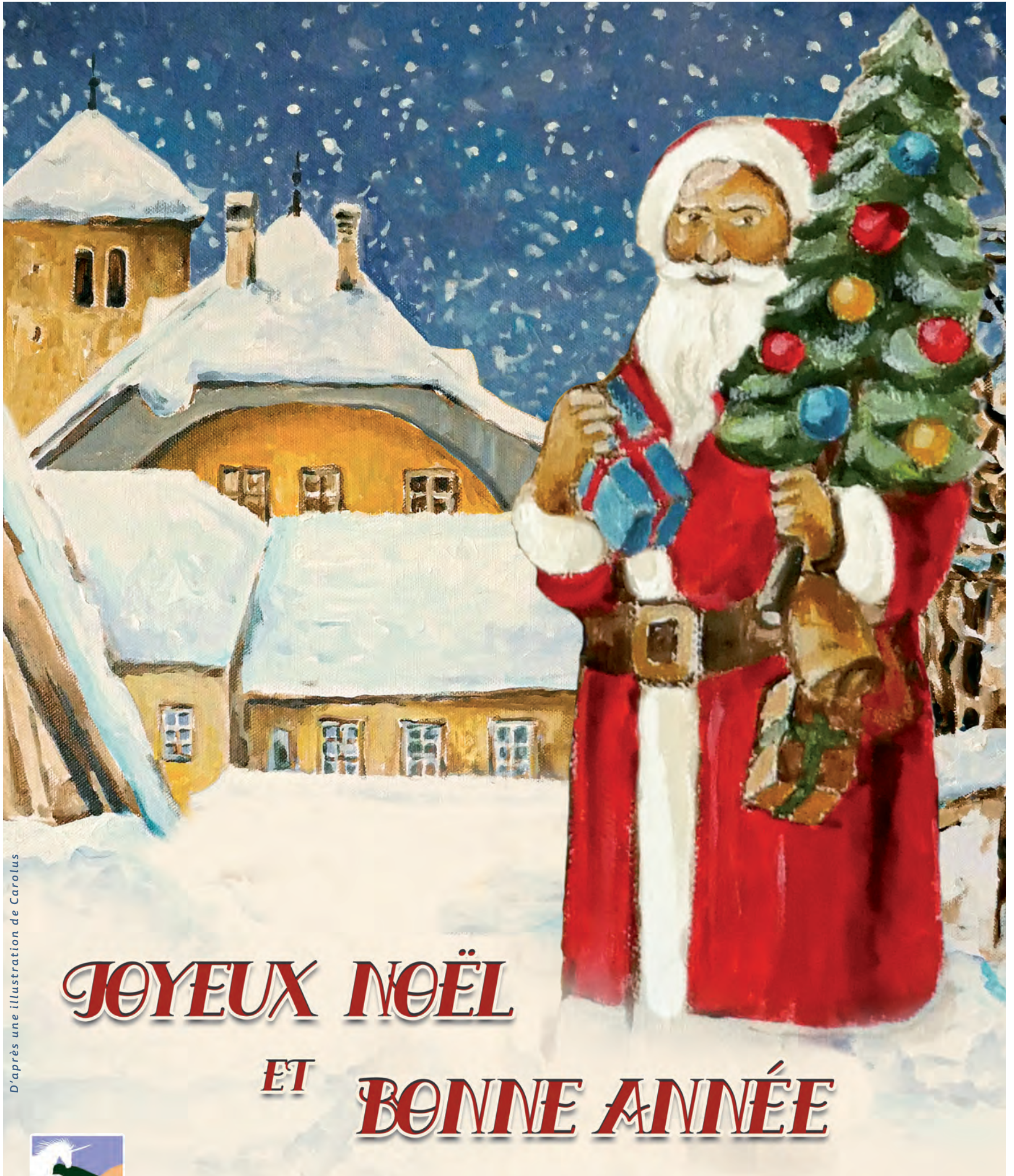
D'après une illustration de Carolus