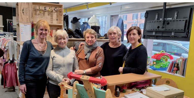
Les bénévoles qui font vivre le lieu.